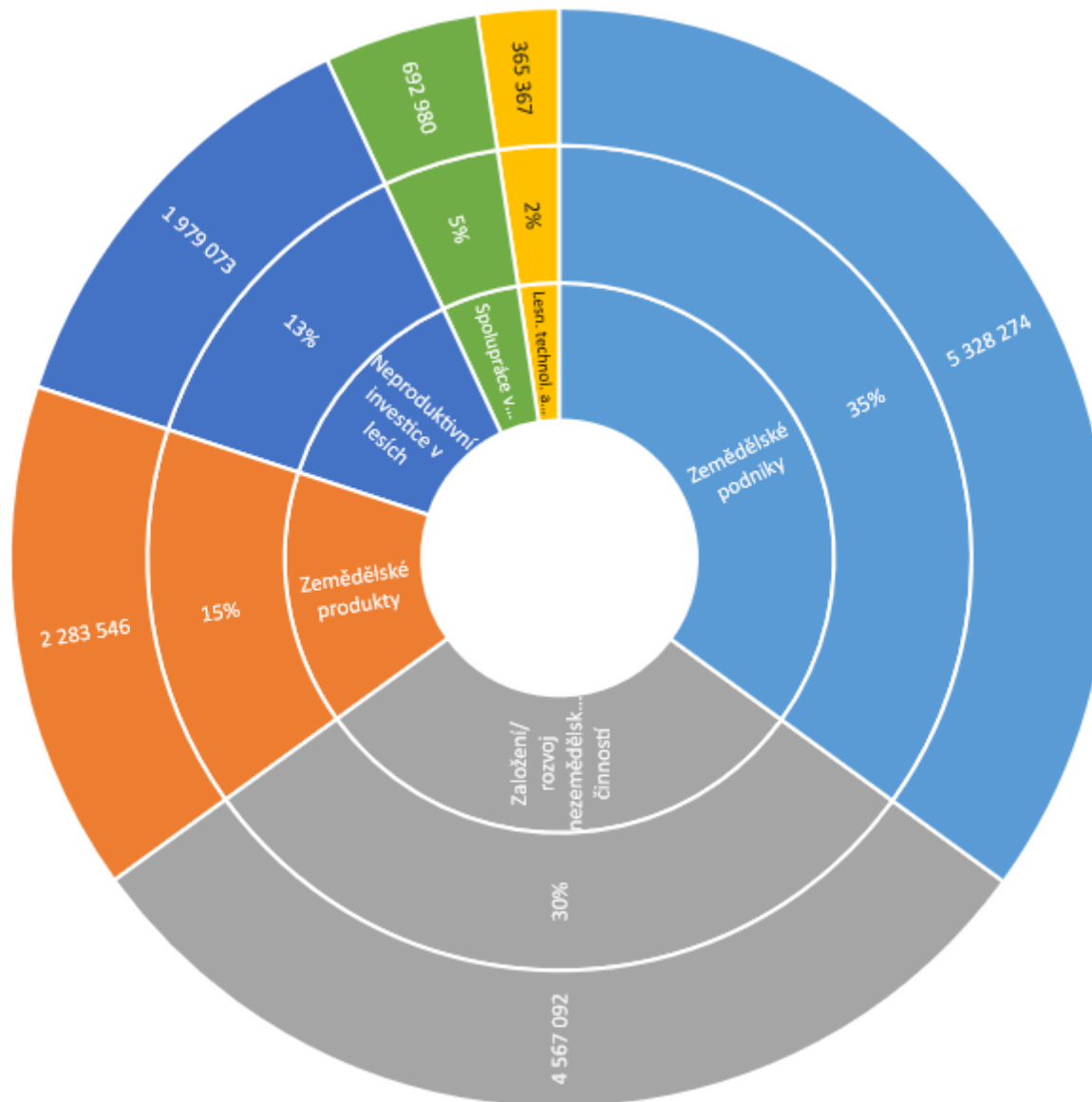
Rozdělení prostředků PRV ve Strategii (CLLD) Luhačovského Zálesí